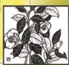
ツバキ(ツバキ科) 早春